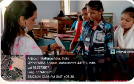
रासेयो विभाग व ग्रामीण रुग्णालय अर्जापूर यांच्या संयुक्त विद्यमाने हत्तीरोग निदान व उपचार शिविराचे आयोजन.