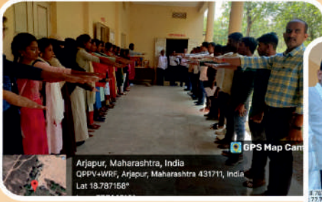
पानसरे महाविद्यालयात घेतली राष्ट्रीय एकात्मतेची शपथ घेताना