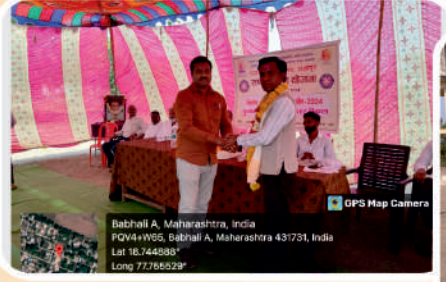
Babhali A, Maharashtra, India POV4+W65, Babhali A, Maharashtra 431731, India Lat: 18.744899° Long: 77.765529°