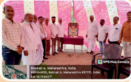
Babhali A, Maharashtra, India POV4+W65, Babhali A, Maharashtra 431731, India Lat: 18.744927°