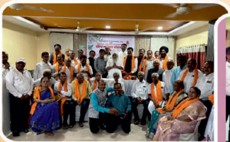
विद्यापीठ परीक्षेतील सेवानिवृत्त क्रीडा संचालकांचे स्नेह संमेलनाचे आयोजन.