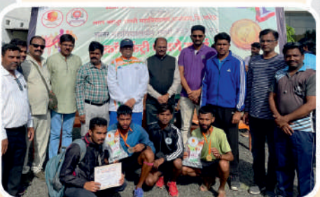
पानसरे महाविद्यालय आयोजित क्रॉस कंट्री स्पर्धेतील सहभागी खेळाडू.