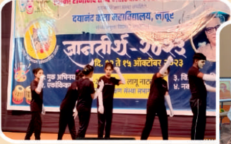
ज्ञानतीर्थ २०२३ युवक महोत्सवामध्ये महाविद्यालयाचे विद्यार्थी मूक अभिनय सादर करतांना.