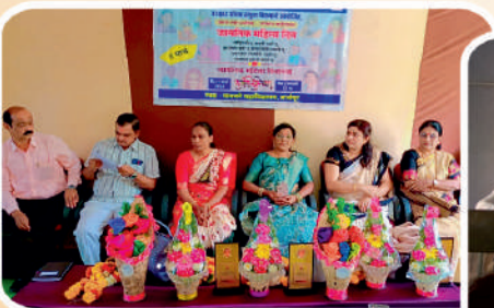
जागतिक महिला दिनानिमित्त जागरूक स्त्री शक्तीचा सन्मान कर्तृत्वाचा कार्यक्रमाचे आयोजन.