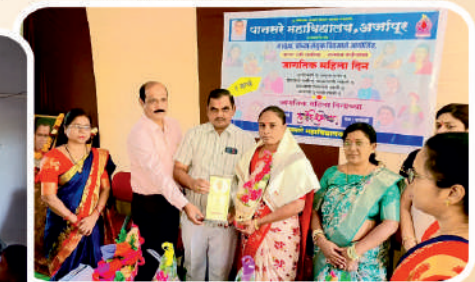
जागतिक महिला दिनानिमित्त महिला गौरव पुरस्काराचे वितरण.