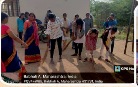
Babhali A, Maharashtra, India POV4+W65, Babhali A, Maharashtra 431731, India