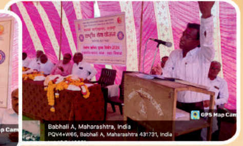
Babhali A, Maharashtra, India POV4+W65, Babhali A, Maharashtra 431731, India