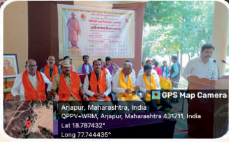
महाविद्यालयात पदवी प्रमाणपत्र वितरण समारंभाचे आयोजन