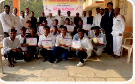
प्रजासत्ताक दिना निमित्त क्रीडा महोत्सव आयोजित क्रीडा स्पर्धेचे बक्षीस वितरण प्रसंगी. संस्थेचे सर्व पदाधिकारी प्राचार्य, प्राध्यापक वृंद व विजेते खेळाडू