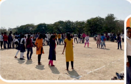
युवा स्पर्दन कबड्डी स्पर्धा (मुली).