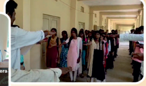
राष्ट्रीय ऊर्जा दिनानिमित्त शपथ घेताना