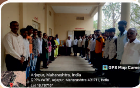
नियमित उपक्रमात महाविद्यालयात जयंती साजरी करताना प्राचार्य व प्राध्यापक.