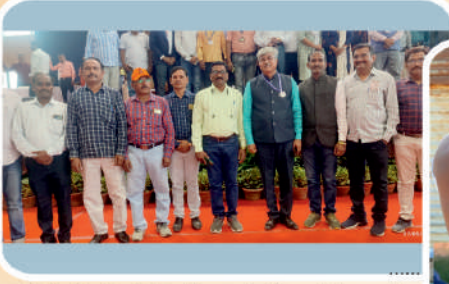
सावित्रीबाई फुले पुणे विद्यापीठात पुणे येथे आयोजित राष्ट्रीय सेवा योजना कार्यक्रमाधिकारी यांच्या अधिवेशनात उपस्थित महाविद्यालयाचे कार्यक्रमाधिकारी.