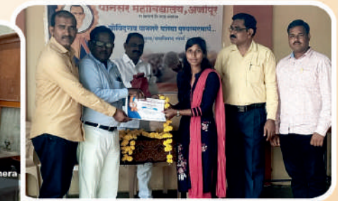
रासेयो विभागाच्या वतीने विविध कार्यक्रमांचे आयोजन करून विजेत्यांना प्रमाणपत्र देत असताना.