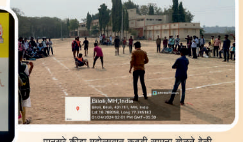
पानसरे क्रीडा महोत्सवात कबड्डी सामना खेळते वेळी खेळाडू व प्रेक्षक.