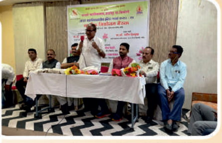
पानसरे महाविद्यालय आयोजित सी झोन स्पर्धा निवडीसाठी बैठक.