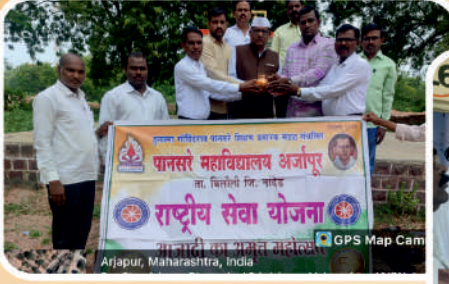
हुतात्मा गोविंदराव पानसरे यांच्या समाधिस्थळी आजादी का अमृत महोत्सव अंतर्गत अमृत कलशाचे संकलन करत असताना प्राचार्य, रासेयो कार्यक्रमाधिकारी आणि प्राध्यापक.