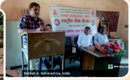
Babhali A, Maharashtra, India

रासेयो च्या विशेष वार्षिक शिबिराच्या उपक्रमात नाविन्यपूर्ण उपक्रम म्हणून पशुचिकित्सा करण्यात आली.