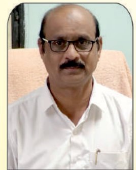
प्रा.डॉ.सय्यद ए. आर. प्र. प्राचार्य, पानसरे महाविद्यालय, अर्जापूर पदसिध्द सदस्य