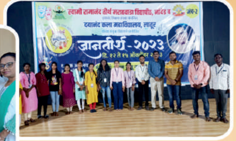
ज्ञानतीर्थ २०२३ महोत्सवास महाविद्यालयातील विद्यार्थ्यांचा सहभाग