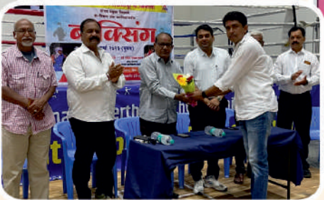
पानसरे महाविद्यालय आयोजित बॉक्सिंग स्पर्धेचे उद्घाटन समारंभ.