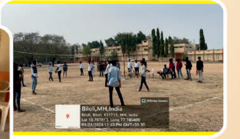
पानसरे क्रीडा महोत्सव २०२४ क्षणचित्र.