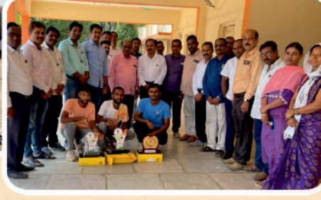
सी झोन अंतर्गत क्रॉस कंट्री स्पर्धेत जनरल चॅम्पियनशिप पटकावल्याबद्दल सर्व खेळांडुना महाविद्यालयाच्या वतीने स्पोर्ट शुज भेट देण्यात आले. प्राचार्य प्राध्यापक, प्रशासकीय कर्मचारी आणि खेळाडू.