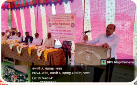
Babhali A, Maharashtra, India POV4+W65, Babhali A, Maharashtra 431731, India Lat: 18.744899° Long: 77.765529°