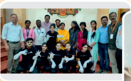
स्वामी रामानंद तीर्थ मराठवाडा विद्यापीठ, चांदेड अंतर्गत दयानंद महाविद्यालय, लातूर आयोजित ज्ञानतीर्थ २०२३ या युवक महोत्सवात एका दहा विद्यार्थ्यांनी सहभाग नोंदविला.