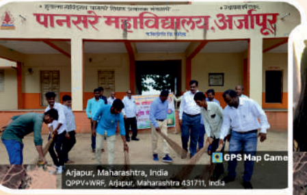
गांधी जयंती निमित्त महाविद्यालयपरिसर स्वच्छ करत असताना प्राचार्य व प्राध्यापक.