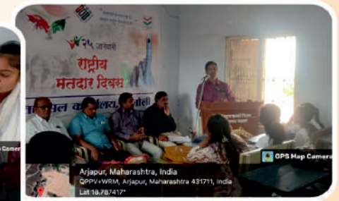
राष्ट्रीय मतदार दिवस महाविद्यालयात नवीन मतदारांची भोंदणी व मतदान जनजागृती निमित्त व्याख्यानाचे आयोजन करून साजरा केला.