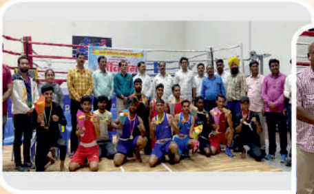
पानसरे महाविद्यालय आयोजित बॉक्सिंग स्पर्धेचे बक्षीस वितरण समारंभ.