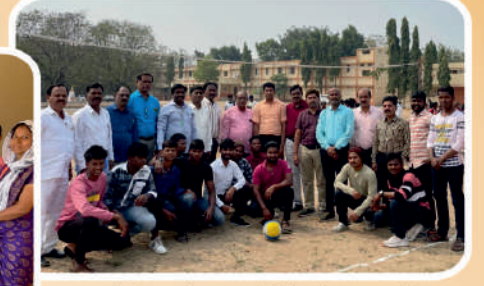
पानसरे क्रीडा महोत्सवात व्हॉलीबॉल चे उद्घाटन प्रसंगी महाविद्यालयाचे प्राचार्य, प्राध्यापक व खेळाडू.