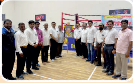
पानसरे महाविद्यालय आयोजित सी झोन बॉक्सिंग स्पर्धेचे उद्घाटन समारंभ.