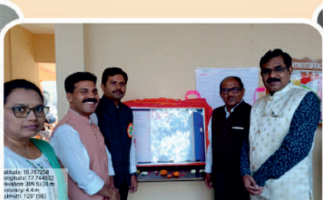
महाविद्यालयात मराठी विभागाच्या वतीने भिती पत्रकाचे प्रकाशन करण्यात आले