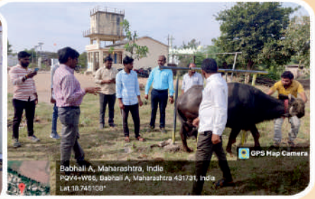
Babhali A, Maharashtra, India POV4+W65, Babhali A, Maharashtra 431731, India Lat: 18.744927°